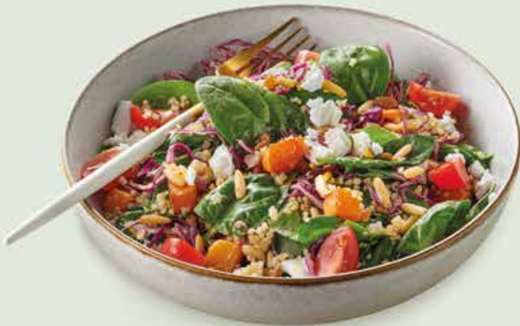
Pumpkin & Vegan Feta Salad