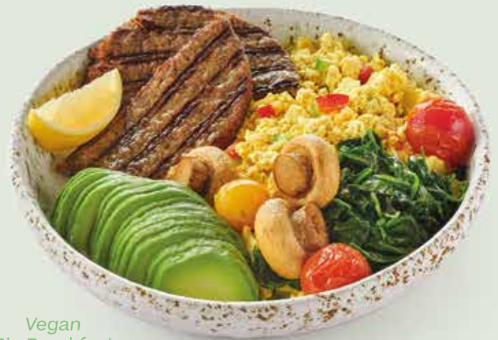
Vegan Big Breakfast

maple & coconut milk infused chia seeds, blueberries, strawberries, raspberries, coconut chips